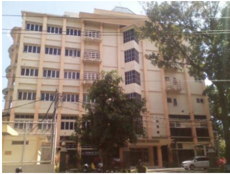
Gambar 3. Tampak gedung TI

Pada kategori EEC, kriteria Optimized Efficiency Building Energy Performance mendapat 9 poin karena IKE listrik berada di bawah standar acuan, sedangkan pada kriteria Testing, Recommisioning or Retrocommisioning mendapat 1 poin. Pada kriteria System Energy Performance diperoleh 3 poin untuk penghematan konsumsi energi daya pencahayaan ruang serta penggunaan minimum 80% lampu LED pada ruang kerja, dan pada kriteria Energy Monitoring & Control mendapat 1 poin dalam hal ketersediaan kWh meter untuk semua sistem dalam gedung.